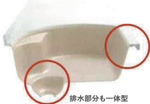
排水部分も一体型