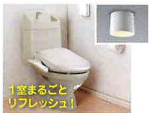
1室まるごとリフレッシュ！