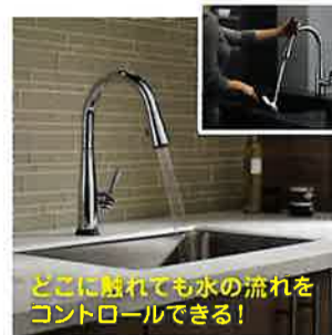
どこに触れても水の流れをコントロールできる！